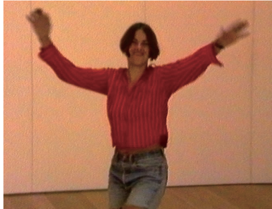
トレイシー・エミン 《なぜ私はダンサーにならなかったのか》1995年

本作品は、作家の告白と共に語られるビデオ作品です。映像の前半ではエミンが育った海辺のリゾート地マーゲイトの風景が映し出され、彼女は1970年代後半にティーンエイジャーだった頃の苦しみを語っています。そして、作品の後半ではエミンはディスコ・ソングに合わせて楽しそうに踊り出します。それは、過去の苦い経験への勝利を示しているのです。