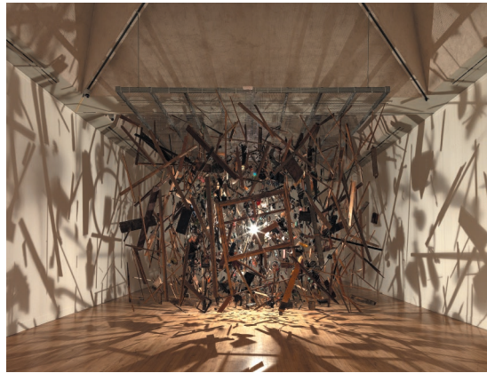
コーネリア・パーカー 《コールド・ダーク・マター:爆発の分解イメージ》1991年 Photo: © Tate © Cornelia Parker Courtesy Frith Street Gallery

本作品は、食器や楽器、レンガといった日常的に目にするものを大量に集め、時に変形させ、天井から吊るす彫刻作品で知られるコーネリア・パーカーの初期の代表作です。作品制作にあたり、作家は英国陸軍に物置小屋を爆破することを依頼しました。その残骸を一つ一つ拾い上げ、照明を落とした密閉された空間の天井から紐で吊るし、中央に強い光を放つ電球を設置しました。このプロセスによって、小屋の断片は空間に浮遊しているように見え、爆発の瞬間を切り取ったかのようなイメージが作り出されるのです。