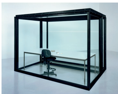
ダミアン・ハースト 《後天的な回避不能》1991年

1980年代後半、英国社会には揺らぎの感情が広がっていました。1979年より続いていたサッチャー政権が推進した自由市場経済と個人主義に基づく英国社会の再建の中で、格差が拡大し、失業率が高まりました。こうした状況の中、アートシーンに登場した作家たちは、マスメディアや大衆文化に想を得ながら「英国らしさ」を鋭く批評する視点を表明したのです。