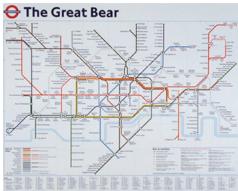
サイモン・パターソン 《おおぐま座》1992年

1990年代初頭には未完成の建築物が目立ち、また、ジェントリフィケーション(都市の富裕化現象)により行き場を失う人が増加しました。それは若いアーティストたちにとって身近な光景であり、創作の着想源となっていたのです。