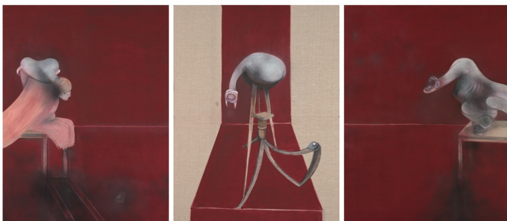
フランシス・ベーコン 《1944年のトリプティック(三幅対)の第2ヴァージョン》1988年 Photo Tate © Estate of Francis Bacon All rights reserved. DACS & JASPAR 2025 G3928

★「ブリットポップ」とは、1990年代半ばの英国で興隆したギター・ロック/ポップ音楽ムーブメントで、90年代の英国における若者文化や社会意識を象徴する言葉です。