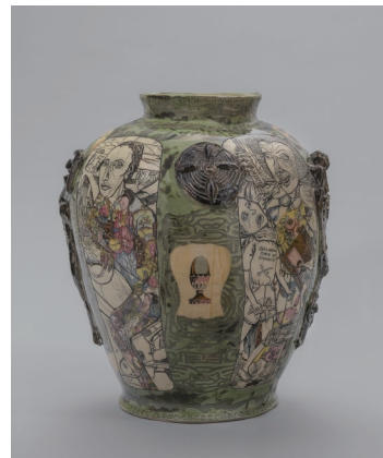
グレイソン・ペリー 《私の神々》1994年

私的な空間を政治的な場と捉えた作家たちにとって、家族関係や個人のアイデンティティも考察すべき重要な問題であり、家庭の風景に潜む暴力や人間関係のひずみ、そして家父長制が個人を抑圧するジェンダーバイアスに正面から向き合う作品は、現代の私たちにも強い共感と深い内省を促すものとして存在しています。