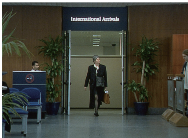
マーク・ウォリンジャー 《王国への入り口》2000年

ロンドン・シティ空港の到着ゲートをスローモーションで捉えた本作品では、イタリア・ルネサンス期の作曲家グレゴリオ・アレグリが旧約聖書詩篇第51篇をもとに作曲した合唱曲「ミゼレーレ」が背景の音楽として選ばれています。作家は、空港を国境に接する地帯、かつ現実世界の王国(英国)への入り口として捉え、その場所の持つ政治的、または象徴的な意味を浮き彫りにします。