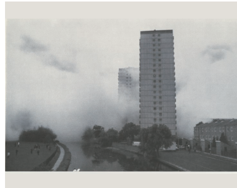
レイチェル・ホワイトリード

Photo: Tate © Simon Patterson and Transport for London