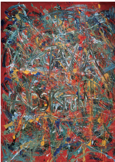
デレク・ジャーマン 《運動失調—エイズは楽しい》1993年

1990年代の作家たちにとって、医学の発展とヘルスケアは大きな関心事の一つでした。薬への信頼と副作用、身体へのコントロールが行われる医療現場もアーティストたちの主題となっていきました。そして、HIVの感染拡大とエイズによる死者の増加は、一つの病の流行の枠組みを超え、人々の間に恐怖、怒り、抵抗の感情を生み出し、多くの作家たちがこの病との関係から作品を制作しました。