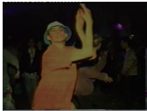
マーク・レッキー