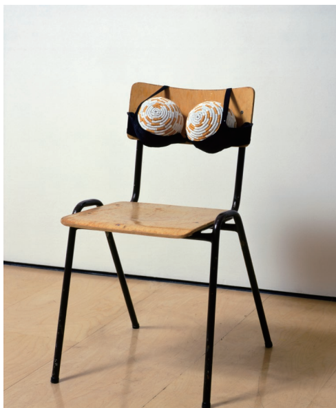
サラ・ルーカス 《煙草のおっぱい(理想化された喫煙者の椅子II)》1999年 © Sarah Lucas. Courtesy Sadie Coles HQ London

私的な空間を政治的な場と捉えた作家たちにとって、家族関係や個人のアイデンティティも考察すべき重要な問題であり、家庭の風景に潜む暴力や人間関係のひずみ、そして家父長制が個人を抑圧するジェンダーバイアスに正面から向き合う作品は、現代の私たちにも強い共感と深い内省を促すものとして存在しています。