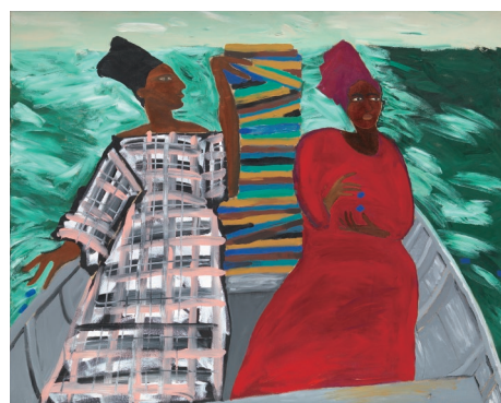
ルベイナ・ヒミド 《二人の間で私の心はバランスをとる》1991年